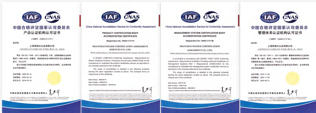
中国认可委认可证书