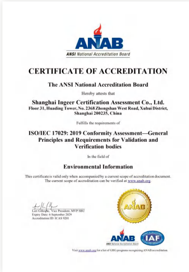
美国国家认可委认可