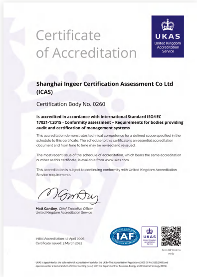
英国皇家认可委认可证书